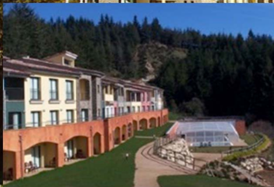
Vilar Rural Sant Hilari Sacalm