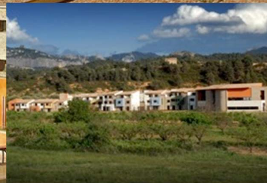
Vilar Rural Arnes