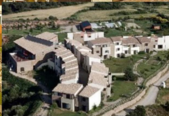
Vilar Rural Cardona