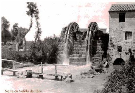
Noria de Velilla de Ebro

Los noriales, que con el azud construido en el río Ebro, y sus molinos asociados, han constituido infraestructuras básicas para el riego hasta mediados del siglo XX en la Comarca de la Ribera Baja, y son un ejemplo de energía sostenible. Su recuperación supone una nueva aportación a los recursos naturales para el abastecimiento de agua de riego, aprovechando complejas estructuras ya existentes, además de poner en valor elementos patrimoniales en el territorio, que preservan la identidad de su población.